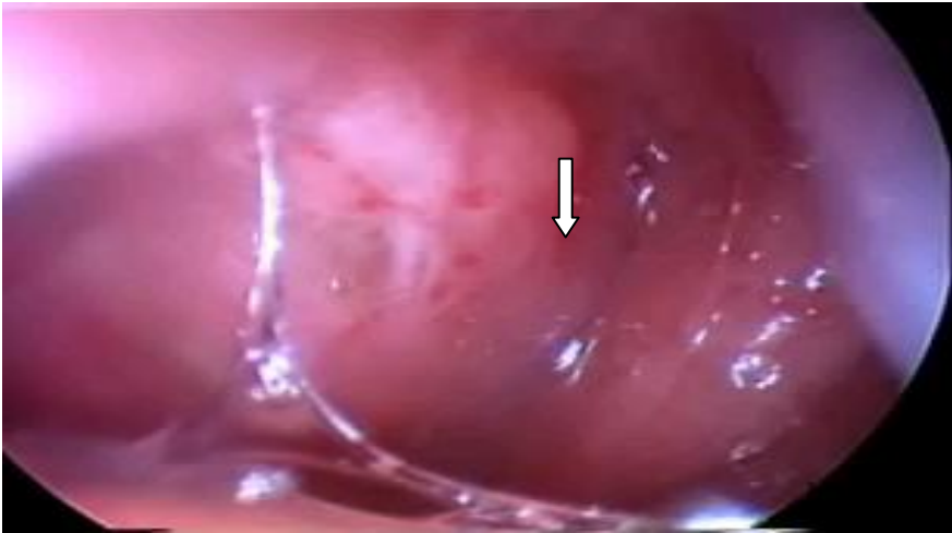
Figure 1 : Aspect d'un cancer du cavum à la nasofibroscope (Tatafasa S., 2009).