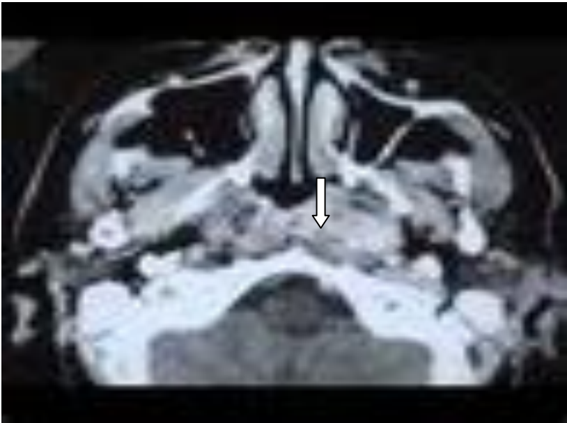
Figure 2 : Tomodensitométrie du massif facial montrant la tumeur située au niveau du cavum (Tatafasa S., 2009).